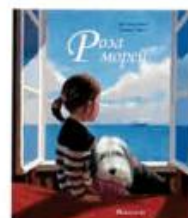
Пенгвйи Ив Роза морей Поляндрия, 2014