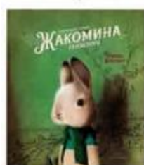
Дотремер Ребекка Настоящая жизнь Жакомо Гейнсборо МИФ, 2020