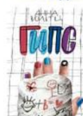
Вольц Анна Гипс Самокат, 2020