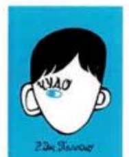
Паласио Р.Дж. Чудо Розовый жираф, 2017