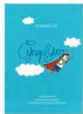
Белл Сиси СуперУхо МИФ, 2017