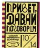
Дрейпер Шэрон Привет, давай поговорим Розовый жираф, 2012