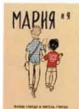
Гаярдо Мигель, Гаярдо Мария Мария и я Бумкнига, 2014