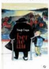
Старк Ульф Белыецы Белая ворона, 2019