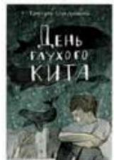
Стрельникова Кристина День глухого кита Речь, 2019