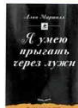
Маршалл Алан Я умею прыгать через лужи Clever, 2015