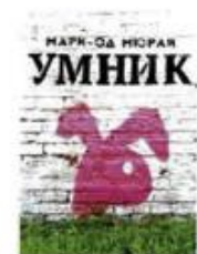
Мюрай Мари-Од Умник Самокат, 2016