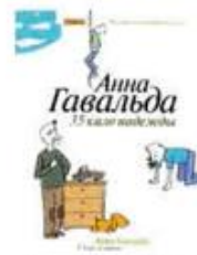
Гавальда Анна 35 кило надежды Флюид, 2009