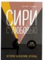
Ньюман Джуди Сири с любовью: история необычной дружбы Теревинф, 2015