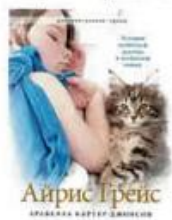
Картер-Джонсон Арабелла Айрис Грейс Livebook, 2018