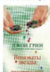
Грин Джон Виноваты звезды АСТ, 2014