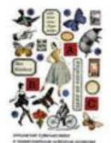
Коллинз Пол Даже не ошибка Теревинф, 2015