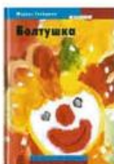
Глейцман Моррис Болтушка ОГИ, 2002