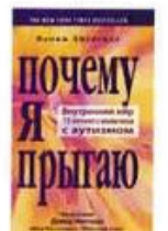
Хигасида Наоки Почему я прыгаю Рама Паблишинг, 2014