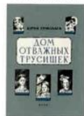
Ермолаев Юрий Дом отважных трусишек Речь, 2016