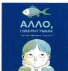
Веккини Сильвия Алло, говорит рыбка Нигма, 2019