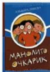
Линдо Эльвира Манолито Очкарик Самокат, 2006