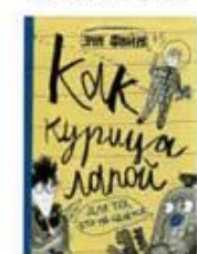
Файн Энн Как курица лапой Самокат, 2017