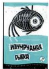
Назаркин Николай Изумрудная рыбка Самокат, 2007