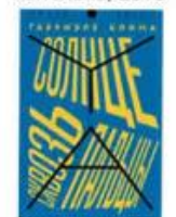
Клима Габриэль Солнце сквозь пальцы КомпасГид, 2019