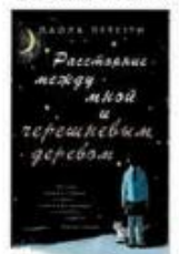
Перетти Паола Расстояние между мной и черешневым деревом Азбука, 2019