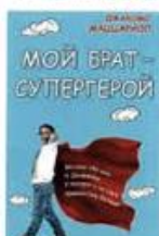
Маццариол Джакомо Мой брат - супергерой Синдбад, 2018