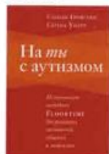
Гринспен Стенли И., Уидер Серена На ты с аутизмом Теревинф, 2016