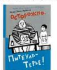
Файн Энн Осторожно, ПитбульТерье! Самокат, 2017

СПБ ГБУ "ЦБС ПЕТРОГРАДСКОГО РАЙОНА" ИННОВАЦИОННЫЙ ЦЕНТР ДЕТСКОГО ЧТЕНИЯ БИБЛИОТЕКА КНИЖНЫХ ГЕРОЕВ