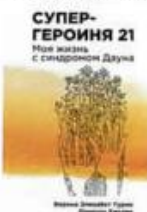
Турин Верена Элизабет, Хмелик Даниэла Супергероиня 21 Дискурс, 2018