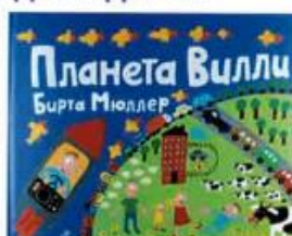
Мюллер Бирта Планета Вилли Самокат, 2015