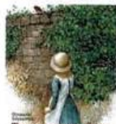
Бернетт Фрэнсис Таинственный сад Махаон, 2013