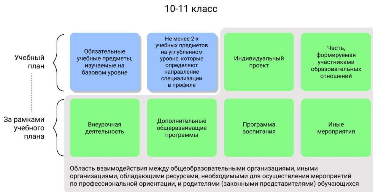
Рисунок 1 – Единая модель профориентации в профильных предпрофессиональных классах – область взаимодействия между общеобразовательными организациями и партнерами

Разработка основной образовательной программы для профильных предпрофессиональных классов проводится с учетом мнения всех категорий участников Единой модели профориентации, представленных на уровне субъекта Российской Федерации, муниципалитета.