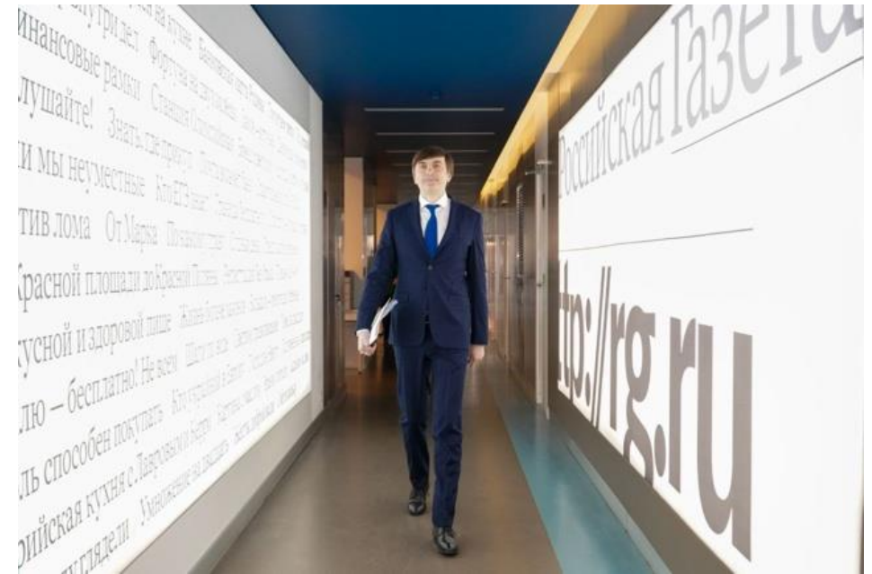
Кравцов Сергей Сергеевич Министра Просвещения РФ

Защитить учителей от травли и посягательств на честь и достоинство вознамерились в Госдуме, куда внесен проект изменения в федеральный закон «Об образовании в РФ». Суть проекта — в принятии мер по защите частной жизни «педагогических работников», в придании им «особого, важного статуса». Прозвучало даже «защитить от травли» учителей в школах.