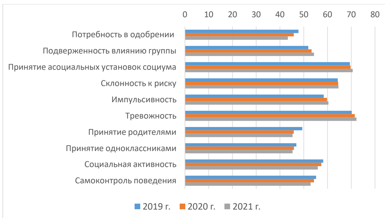
Рис. 2. Динамика значений показателей СПТ у учащихся 7–9 классов группы риска, 2019–2021 гг.

Визуально выявленная динамика значений показателей СПТ у учащихся 7–9 классов группы риска в 2019–2021 гг. на рис. 2.