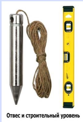
Отвес и строительный уровень